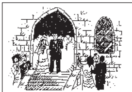
3. Pamela y Tomás